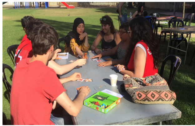
Foto: Tarda de Jocs

Entitats i serveis implicats a “Les tardes d’estiu al carrer 2016”: Agrupament Escolta i Guia Collformic, Agrupament Escolta Guillem de Montrodon, Agrupació de Sords de Vic i Comarca, Associació Abaraka Bake, Associació Casal Claret, Associació CineClub Vic, Associació de Comerciants del Passeig, Associació de Disminuïts Físics d’Osona, Associació EVAL, Associació La Fàbrica dels Somnis, Associació Tapís, AURORA Gestió de Projectes Socials, Casa d’Oficis, els Centres d’Atenció Primària de Vic, Club Natació Vic, Comissió de Festa Major Jove de Vic, Consell Esportiu d’Osona, Colla del Merma, Colla del Nen, Colla de la Vella, Creu Roja Osona, Gargamel Juguines, Institut Municipal d’Esports, Juguines Sense Fronteres, Joves en Moviment, Llar Juvenil, Nits de Cinema Oriental, OAR Vic i Ajuntament de Vic.