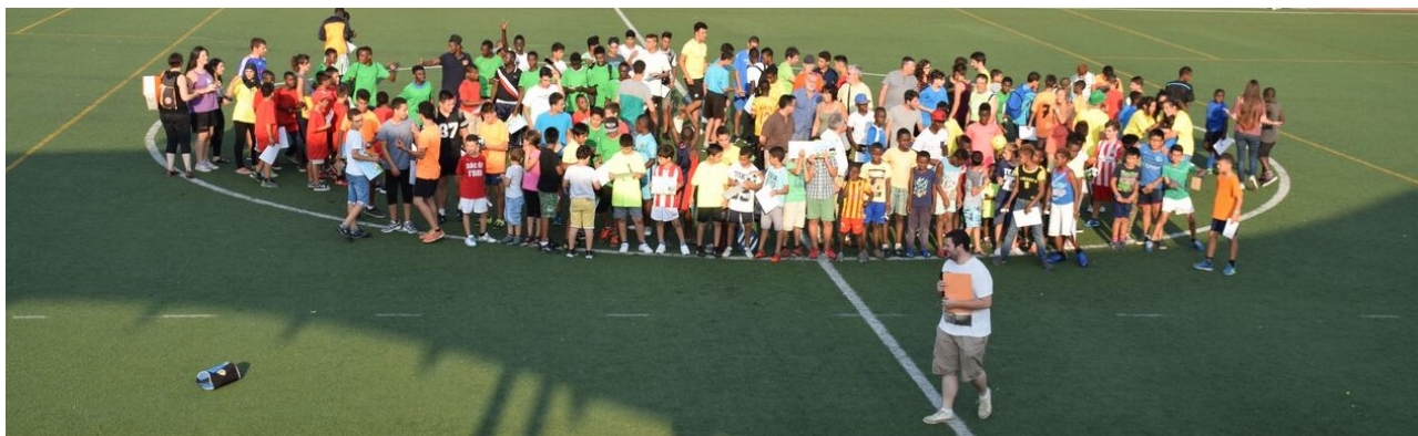
Foto: Festa de Cloenda