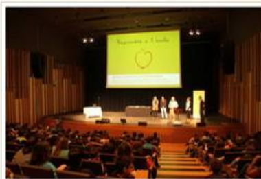
Els possibles futurs emprenedors de la ciutat han vist recompensada la feina de tot el curs

Els alumnes participants al projecte Emprendre a l'escola han presentat les experiències que han treballat durant tot aquest curs