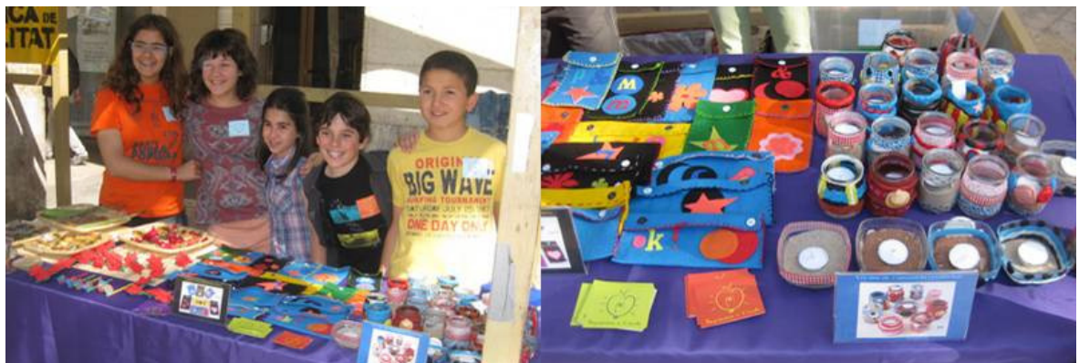
Escola Sant Jordi

L'escola L'Aragai no van estar físicament el dia del Mercat perquè van decidir no produir articles per la venda a canvi de la realització d'una obra de teatre, celebrada el dia 7 de juny a l'IES Dolors Mallafrè. Tot i així, el dia del mercat es va aprofitar per fer publicitat de l'obra.