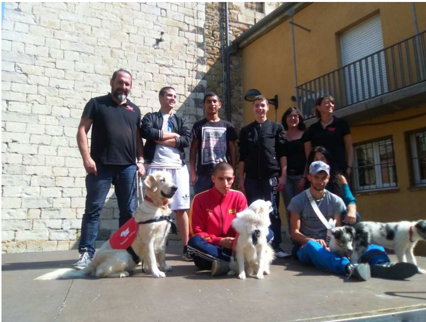
Taller de gossos amb teràpies canines