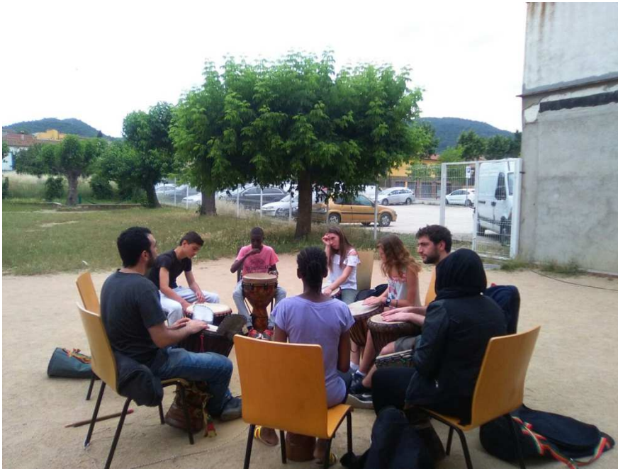
Comitat del Centre Obert 2017