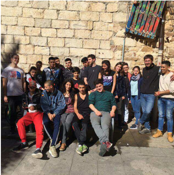
Joves del Local Jove