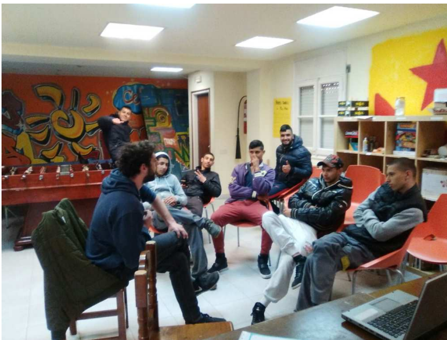
Sessió sobre la història de la Guerra Civil