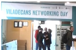
VILADECANS NETWORKING DAY