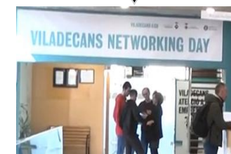
VILADECANS NETWORKING DAY