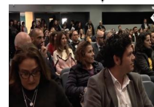
Jornada d'informació i reflexió amb els agents