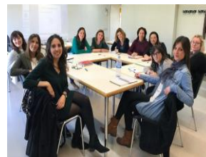
Comissió agents socials "COMPARTIM"