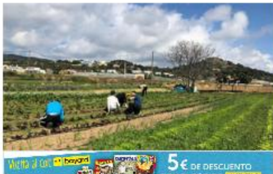
Jóvenes participantes de la primera edición del curso Arrelem de Mataró.