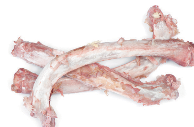
Restes de carn