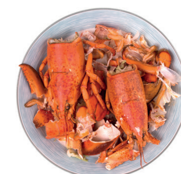
Restes de marisc