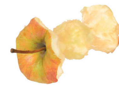
Restes de fruites