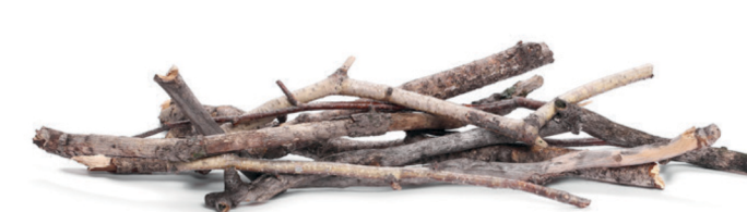
Petites restes de poda