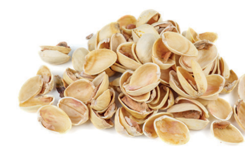
Restes de fruita seca