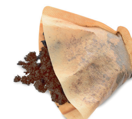
Restes de cafè i infusions