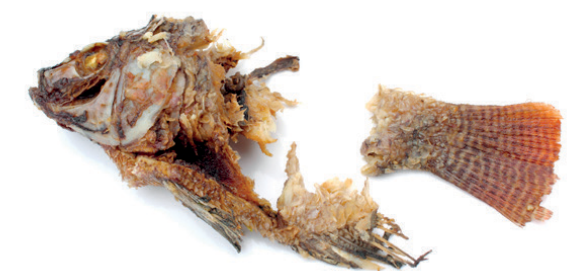
Restes de peix