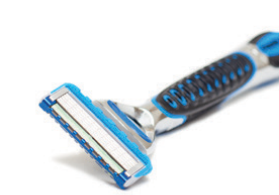
Altres residus no orgànics