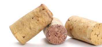
Taps de suro