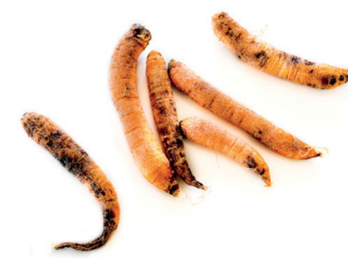
Restes de verdures