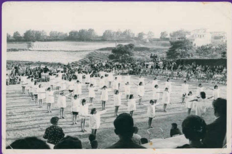
“Cartilla escolar de educación física”. Madrid: Ediciones Frente de Juventudes, 1945. P. 178-179.