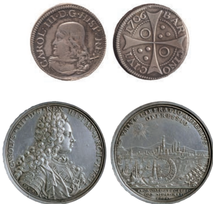
La numismàtica i la medallística permeten estudiar aspectes tecnològics, ideològics, socials i econòmics de les societats del passat. Són també un molt bon element de datació arqueològica.

numismàtica, carpologia, paleoarqueologia, datacions per radiocarboni, prospecció superficial geofísica per georadar, etc.