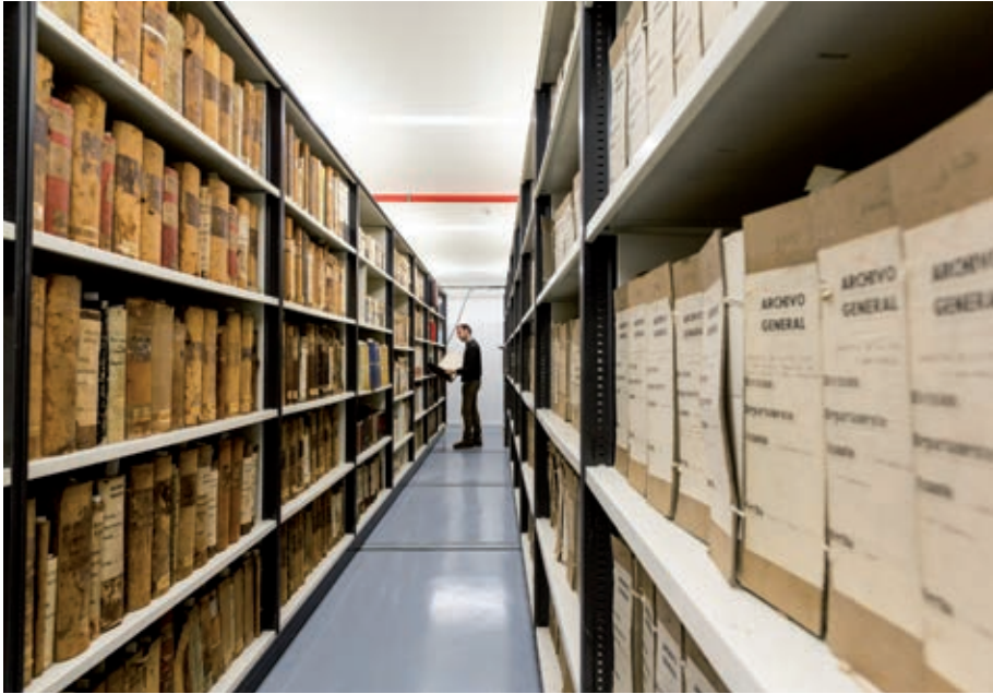
Dipòsit de l'Arxiu de l'Hospital de la Santa Creu i Sant Pau. Fotografia de Robert Ramos / Fundació Hospital de la Santa Creu i Sant Pau.

són incomplets sense la realització d'intervencions arqueològiques programades a espais d'expectativa arqueològica per a l'estudi de la societat precapitalista.