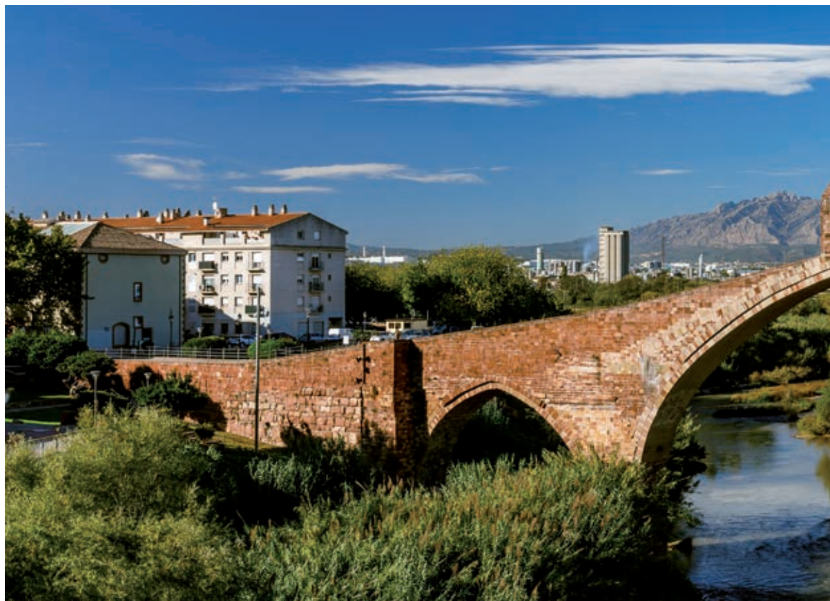
El Pont del Diable és un dels elements arquitectònics de Castellbisbal amb la màxima protecció de BCIN.

(restes del monestir), el turó de la Verdolaga, la pedrera de Can Campanyà, la vila romana Can Pedrerol de Baix, les restes al camí de l'Ermita de Sant Vicenç, la successió miocena de la Costablanca, el turó de la Gatzarella (Gatzarella) i el turó de les Guàrdies.