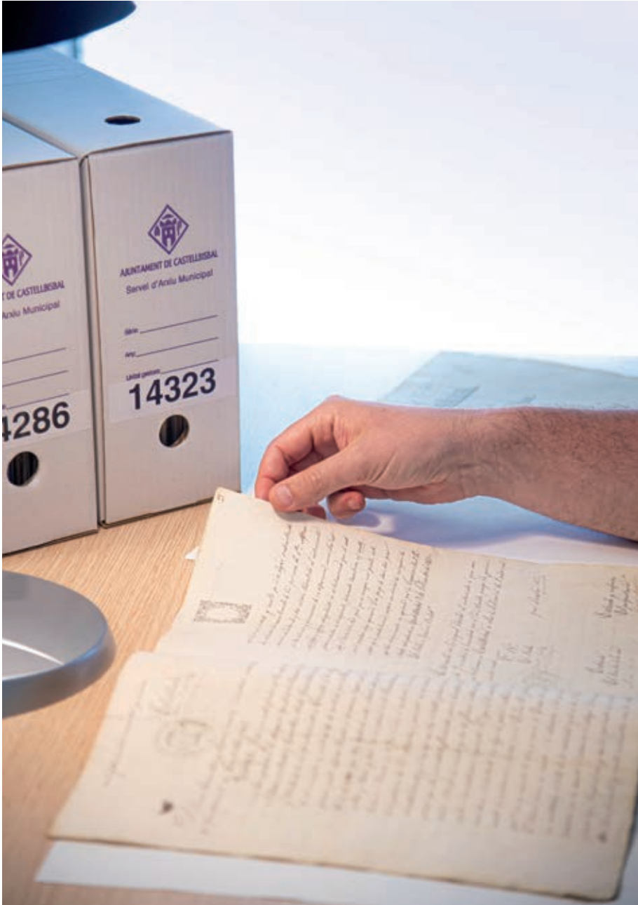
Consulta a l'Arxiu Municipal de Castellbisbal.