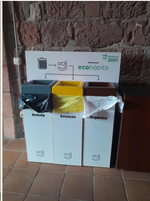
Punts de recollida selectiva del Projecte “ECO HÀBITS”