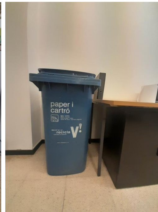
Bujols de 240L de les dependències municipals per a la recollida porta a porta de paper