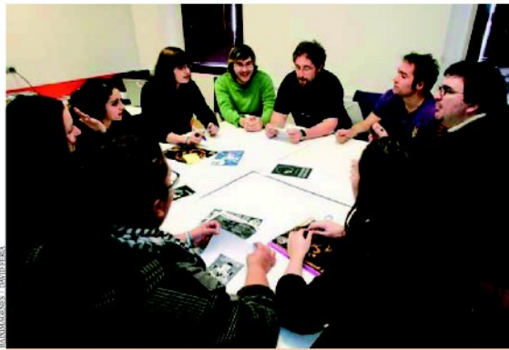
Joves participants en el curs de dinamització d'oci nocturn alternatiu que es va celebrar a La Casa Gran

La iniciativa també té el suport de la Fundació Mariano de Sant Boi, que duu a terme el programa "Vente pa'ka", i de l'Associació juvenil Gijón Abierto hasta el Amanecer, capdavantera a escala estatal a promoure un projecte d'oci nocturn que té més d'onze anys d'experiència.