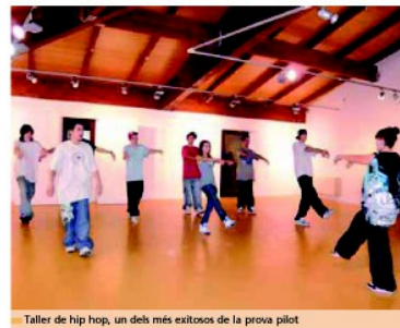
Taller de hip hop, un dels més exitosos de la prova pilot

La prova pilot va ser la culminació del primer curs de dinamitzadors d'oci nocturn alternatiu que va permetre als i les joves participants dissenyar la primera programació del Desveladoos.