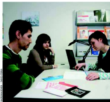
L'assessoria sociolaboral de l'Oficina d'Emancipació ofereix atenció personalitzada el segon i quart dimecres de mes de 17 a 20 hores

Ben aviat es posarà en marxa l'assessoria de la salut, sobre temes relacio-