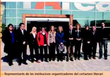
Representants de les institucions organitzadores del certamen literari

El certamen literari està organitzat per onze municipis del Baix Llobregat i té el suport de diferents institucions entre elles el Consell Comarcal que s'hi incorpora enguany.