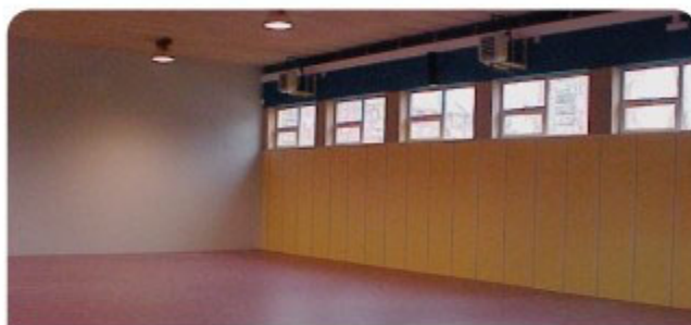
Interior del gimnasio del CEIP Vicente Aleixandre de Martorell, similar al que se construirá en el CEIP Jaume Balmes.

Con estas mejoras la calle Riu Llobregat se convertirá definitivamente en el eje principal del barrio. Una calle bien preparada para el comercio, el paseo y la relación ciudadana.