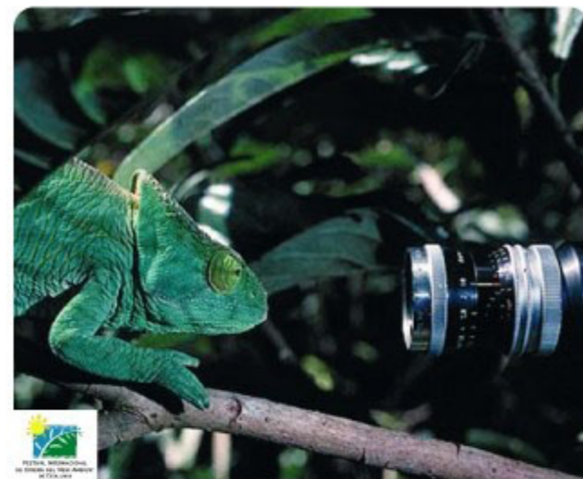
El proper festival de Medi Ambient es celebrarà al Prat entre l'1 i el 10 de juny de 2007

El centre de Serveis Educatius, juntament amb el Centre Esplai, la nova comissaria dels Mossos, la nova seu d'Aigües del Prat i l'ampliació i millora del CAP convertiran aquest punt del carrer del Riu Llobregat en un dels majors centres de gestió del Prat de Llobregat.