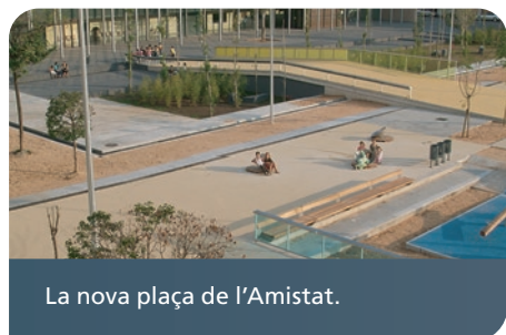
La nova plaça de l'Amistat.

Comencem una nova etapa i la comencem amb optimisme i amb bones perspectives per a tot el Prat, i de manera molt significativa per a Sant Cosme.