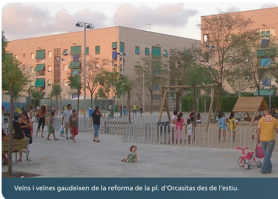
Veïns i veïnes gaudeixen de la reforma de la pl. d'Orcasitas des de l'estiu.