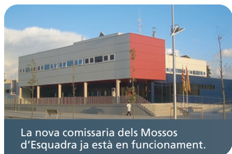
La nova comissaria dels Mossos d'Esquadra ja està en funcionament.