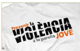
Campanya Prevenir la violència a la parella jove Ajuntament de Sant Feliu de Llobregat