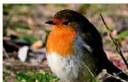
Col·lecció de llibres Els ocells a Sant Joan Despí Centre Mediambiental L'Arrel