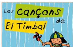
Cançoner infantil Escola bressol El Timbal