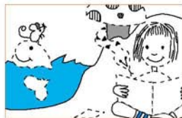
Guia de la biblioteca de l'escola per a nens de 3 a 5 anys Biblioteques escolars de Cornellà Ajuntament de Cornellà