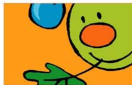
Mascota corporativa Club d'Esplai El Tricicle