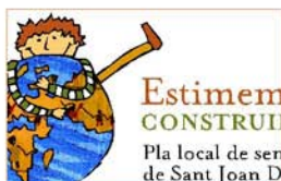
Manual d'imatge corporativa Estimem el món, construint la pau Departament de Solidaritat Ajuntament de Sant Joan Despí