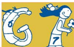
Campanya de sensibilització a les escoles de primària sobre els Drets de l'Infant Ajuntament de Sant Joan Despí