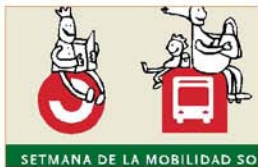
Setmana de la mobilitat sostenible i segura Departament Mediambient Ajuntament de Sant Joan Despí