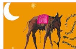
Carnaval "Sant Joan Dalí" Departament de Cultura i Participació Ciutadana Ajuntament de Sant Joan Despí