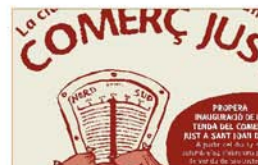
Comerç Just Fundació Santa Magdalena