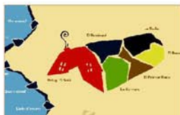
Pàgina web de serveis Associació El Solà www.elsola.org