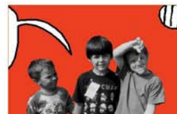
Publicidad institucional Centre d'Esplai El Nus