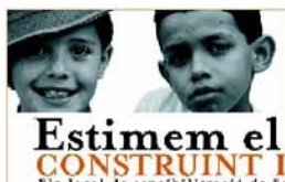
Campanya Utopies concretes Departament de Solidaritat Ajuntament de Sant Joan Despí