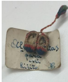
Joguina feta amb pinyols