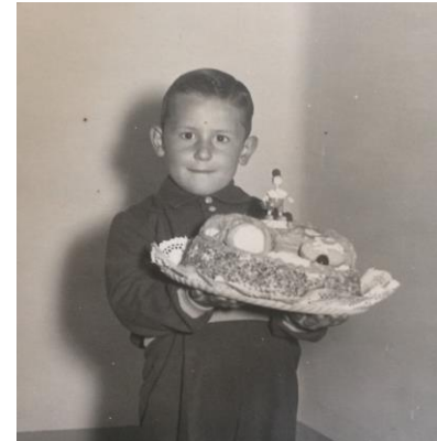
Dia de la Mona

- A casa no anàvem a comprar a la pastisseria i ens fèiem nosaltres uns braços de gitano de nata i de vegades la mare feia un pastís anomenat Florentina.