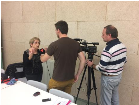
Entrevista Canal Terrassa

- Llavors a totes les cases hi havia pous i patíem moltes humitats.