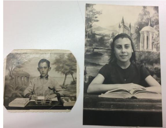
Fotos de l'escola parroquial de Sant Josep