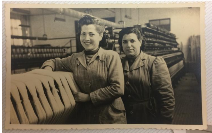
Treballant a la fàbrica tèxtil Laborlana de les 4 carreteres