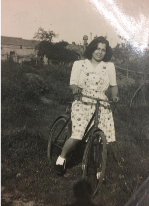
Amb bicicleta al horts d'una casa de can Palet

- Quan tenia 17 anys en un ball que es feia al garatge del Autocars Gómez vaig conèixer a la que seria la meva muller i que llavors només tenia 15 anys. En aquest garatge s'hi feien els balls de Festa Major, l'envelat que llavors en dèiem i recordo que estava al costat de la Fundició Puntí (cal indicar que algú explica que de més antic els balls es feien a cal Missert).