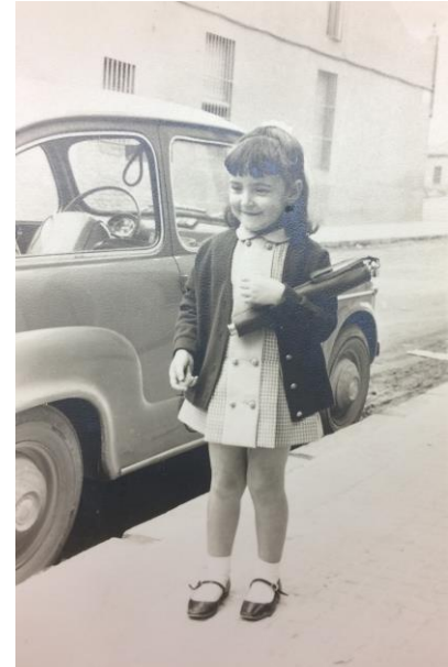
Als carrers de can Palet

- Els jocs que recordo més són, a cuc i amagar, al pare carbasser, a saltar a corda, als quatre cantons, a arrencar cebes i al rasca vi on un grup es posava ajupit i els altres els saltaven a l'esquena tot cantant: rasca vi, rasca vi, quan et cansis digues fava i llavors feien la cantarella de mango, mediomango i mangoentero mentre es tocaven les parts del braç, i si els que estaven a sota endevinaven quina part es tocava llavors s'intercanviaven les posicions.