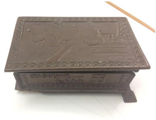
Caixeta de fusta amb el dibuix de la casa de la "bomba de l'aigua"

- El meu pare treballava a la central elèctrica de can Barba i recordo que els pagesos del voltant li donàvem raïm que ell ens portava a casa on l'esperàvem els sis fills que tenia. Quatre érem fills de la seva primera