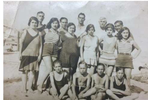
Dia de platja