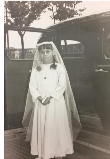
Taxi en la primera comunió

- Jo he portat totes les joguines que el meu pare em va fer durant el temps que va estar empresonat a la Model, després de la guerra civil.