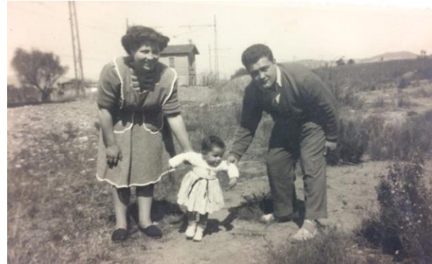
Els camps de can Palet

- A l'hora de collir el raïm i de trepitjar-lo també hi anava i recordo que per fer-ho ens posàvem amb els peus nus dins d'un cup i gràcies a unes cordes que penjaven del sostre t'hi agafaves per no relliscar. No gaudia poc la canalla quan ens deixaven trepitjar-lo.