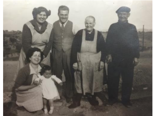
Diferents generacions al barri

- Els meus pares van anar de Barcelona a viure al carrer Colom el 1912 i les cases on van anar a viure eren arrenclerades i totes iguals.