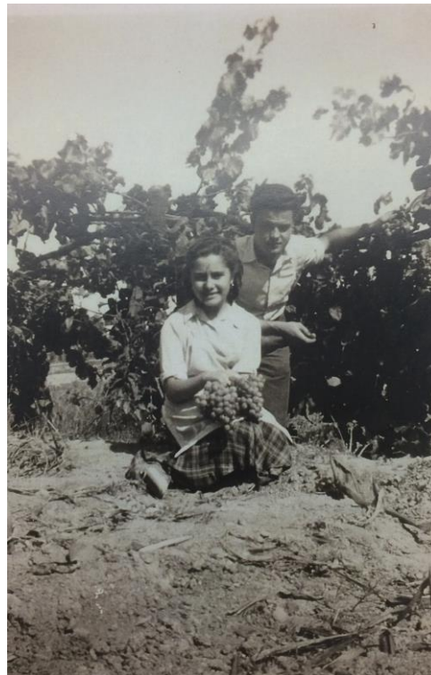
Vinyes de can Palet

- Jo vaig néixer a Montefrio, Granada, i quan tenia 6 anys vaig arribar a Ullastrell i poc després ens vàrem traslladar a la Cogullada de Terrassa. Llavors anava al col·legi Torrella de la Rambla i vaig fer forces amics de can Palet. Molts dies anava a jugar amb ells als boscos del costat de la Masia de can Palet o a la part de sota on hi havia els horts. També recordo que jugàvem al cementiri vell que ja s'havia començat a traslladar i hi havia un munt de caixes de morts desballestades.